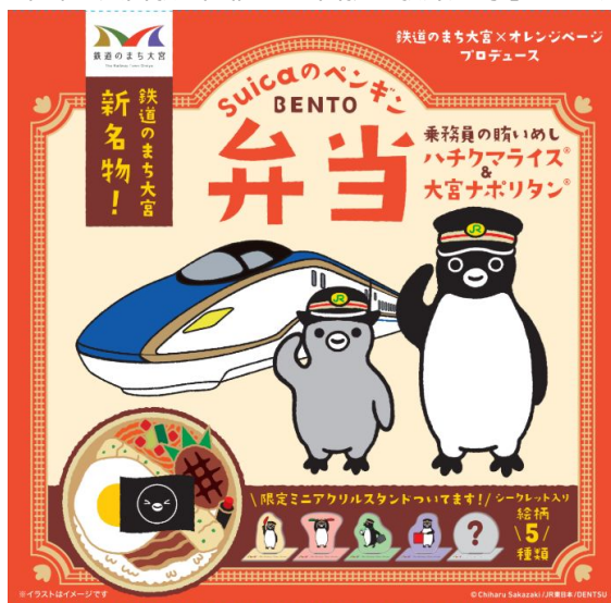
※ 画像はイメージです。 ※都合により内容が変更する場合があります。

オレンジページがプロデュースするSuicaのペンギン弁当として第5弾となる今回は、「乗務員の誇いめし」をイメージした「ハチクマライス」と大宮のご当地グルメ「大宮ナポリタン」を盛り込み、Suicaのペンギンの好物でもある魚肉ソーセージの磯辺揚げも入った「鉄道のまち大宮」の新名物弁当に仕上げました。