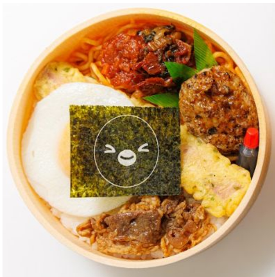
鉄道のまち大宮 新名物！ Suicaのペンギン弁当 ハチクマライス×大宮ナポリタン