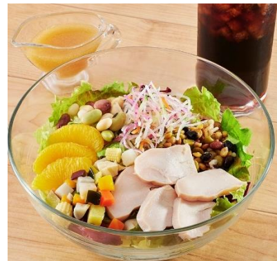
(POWER サラダ～サラダチキンと20種野菜～ 単品 520円/ドリンク付 720円)