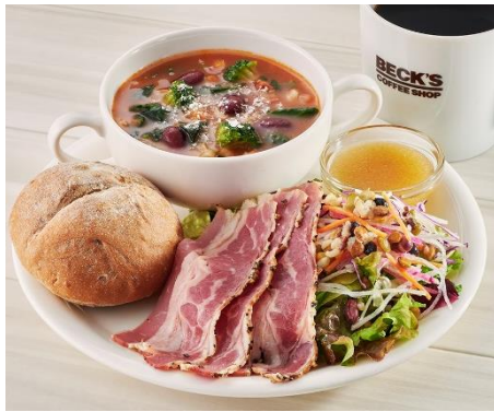
(30品目プレート ～ミネストローネとパストラミビーフのサラダ～ 単品 660円/ドリンク付 860円)