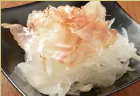
オニオンスライス 300円