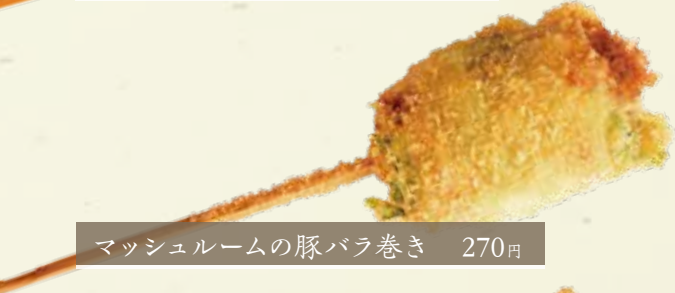
マッシュルームの豚バラ巻き 270円