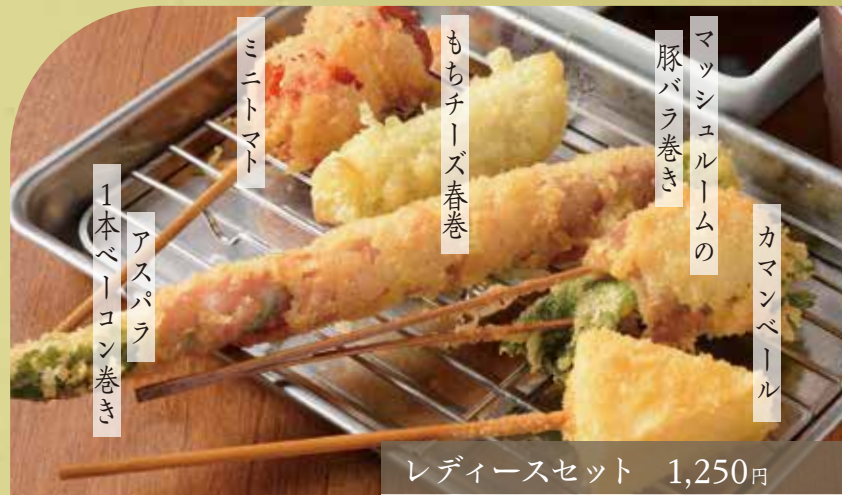
1本ベーコン巻き アスパラ