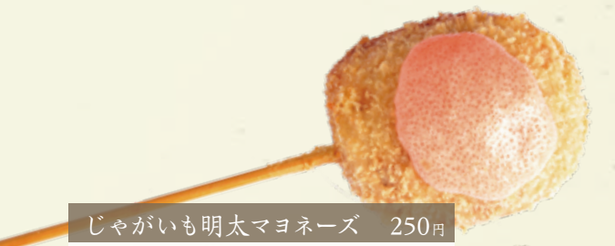
じゃがいも明太マヨネーズ 250円