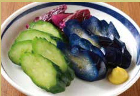
お新香盛り合わせ 500円