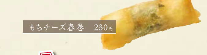
もちチーズ春巻 230円