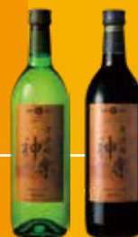
岩手県産のワイン エーデルワイン 早池峰神楽