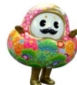
石川県観光PRマスコットキャラクター 「ひやくまんさん」